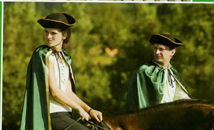
Cavalliers costumés, lors d'un mariage au monastère cistercien de Kostanjevica...