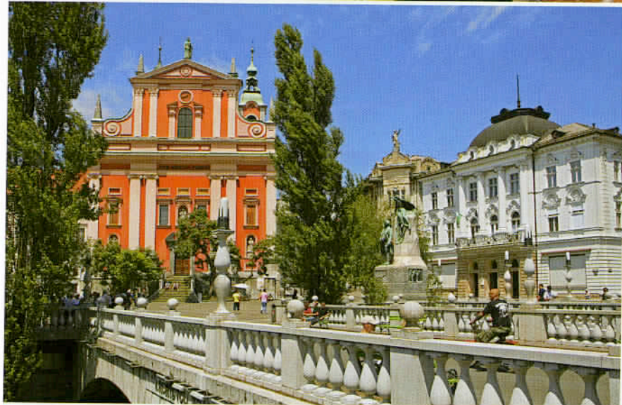
Le vieux pont Spital et l'église baroque Ste-Marie de l'Annonciation composent l'un des incontournables décors de Ljubljana.

Ensuite, Ljubljana - la capitale - constitue le centre politique, économique et culturel, scientifique et éducatif, ainsi que le carrefour des axes de communication. La ville réunit à sa façon les caractéristiques des pays de l'Est et de l'Ouest, du Nord et du Sud. Elle se déploie aux pieds d'une colline, sur laquelle se dresse le fier château de Ljubljana dont la vie culturelle, très animée, est entretenue par de nombreux théâtres, musées, galeries, cinémas, plus de dix mille manifestations culturelles par an et dix festivals internationaux, tels le Festival d'été de Ljubljana, la Biennale d'art graphique, le Festival international de jazz, le Festival du Film de Ljubljana ou le Festival des musiques du monde. On tombe aussi, pour ainsi dire à chaque pas, sur d'agréables cafés, pâtisseries, restaurants et auberges, de ceux qui proposent une gastronomie typiquement slovène aux établissements servant une cuisine choisie, issue d'horizons les plus divers. Grâce à son université, le quotidien de la ville est vivifié par l'affluence d'une jeunesse débordante. Pour retrouver son souffle, on peut se laisser aller aux charmes désuets